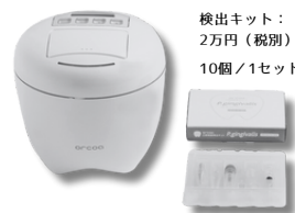
検出装置：40万円（税別）