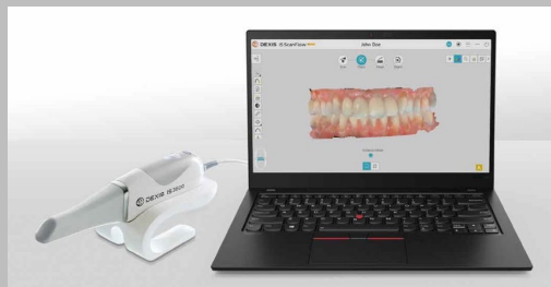
デジタル印象採得

近年、補綴や修復治療の材料が変革がしている中、支台歯形成の削り方や形成形態も変化しています。CAD/CAMを用いた修復物を正しく作製して、精度の高い治療を行うためには、支台歯形成から印象採得の流れを理解する必要があります。本セミナーでは、デジタル補綴を念頭にハンズオン実習を行なって理解を深めていただきます。