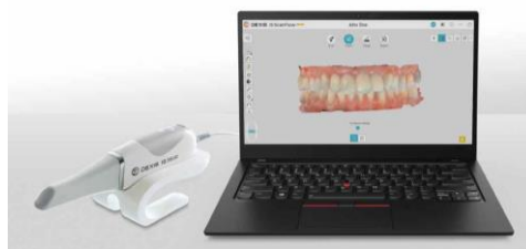
デジタル印象採得