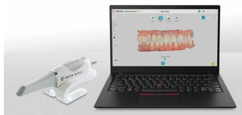
デジタル印象採得